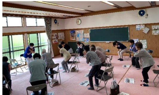
長野地区にてロコトレ教室の様子

今年度、青羽根地区と長野地区では、行政主催のロコトレ教室を開催し、その後、ロコトレOB会が立ち上がりました。このOB会は住民が主体となつて運動や脳トレ等を組み合わせ、楽しく笑いのある通いの場となっています。青羽根地区は毎月第1・3火曜日、長野地区は毎月1回開催しています。来年度のロコトレ教室開催地区を募集しておりますので、天城包括までご連絡下さい。