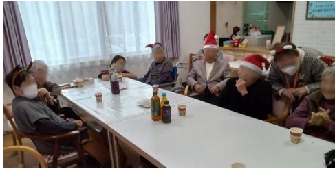
認知症カフェそ〜まにてクリスマス会の様子

認知症のある当事者や、その家族の不安・生活の中での困り事を参加者やボランティアさんと共有し、楽しいひと時を過ごす会です。 どなたでも参加可能 です。