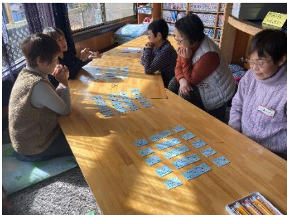
百人一首で脳トレ中の様子