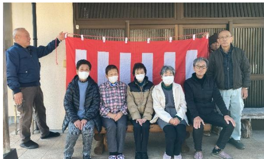
市山公民館にて寄贈式の様子

ベンチプロジェクトとは、地域住民が集う場や日常の散歩コースなどにベンチを設置することで、誰もが気軽に集える場を増やし、社会参加・見守り・交流や情報交換の場として活用することを進めるプロジェクトです。現在、天城湯ヶ島地区には7ヶ所に設置されており、今年度は市山公民館の出入り口に設置させていただきました。今後もベンチの設置や活用にご協力していただける方を募集しています。