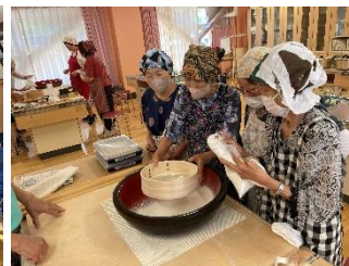
蕎麦打ち講座の様子